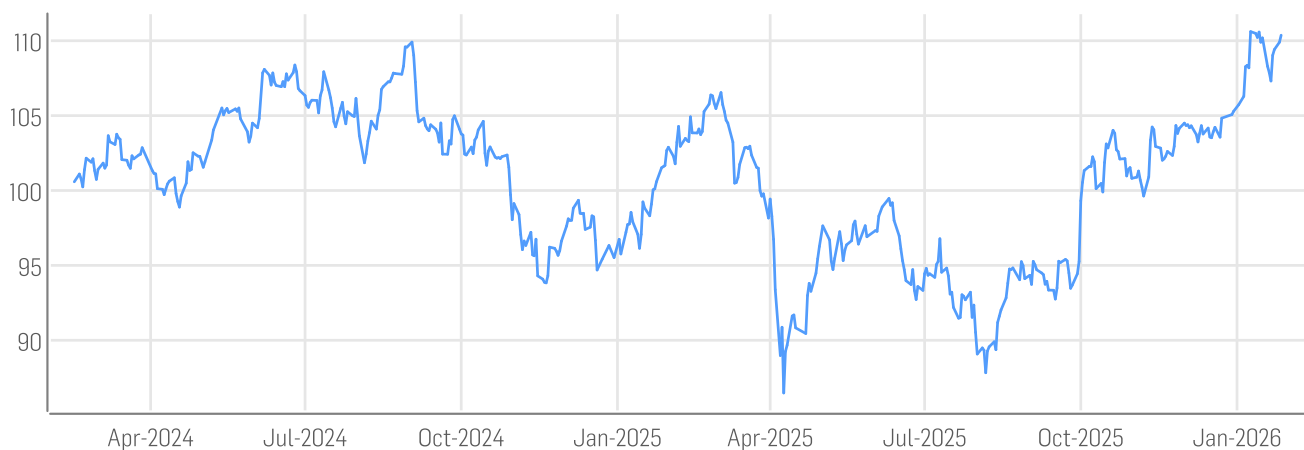
■ DER AKTIONÄR GRANOLAS - European Champions Index