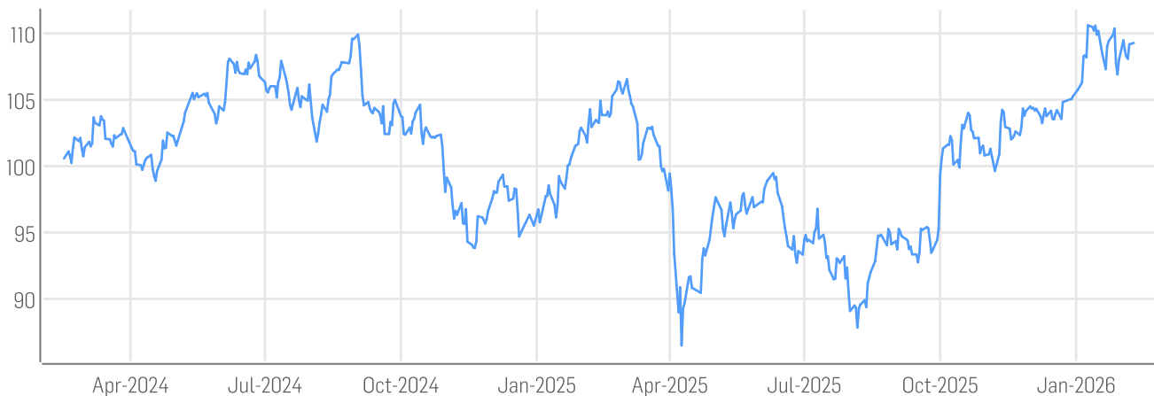
■ DER AKTIONÄR GRANOLAS - European Champions Index