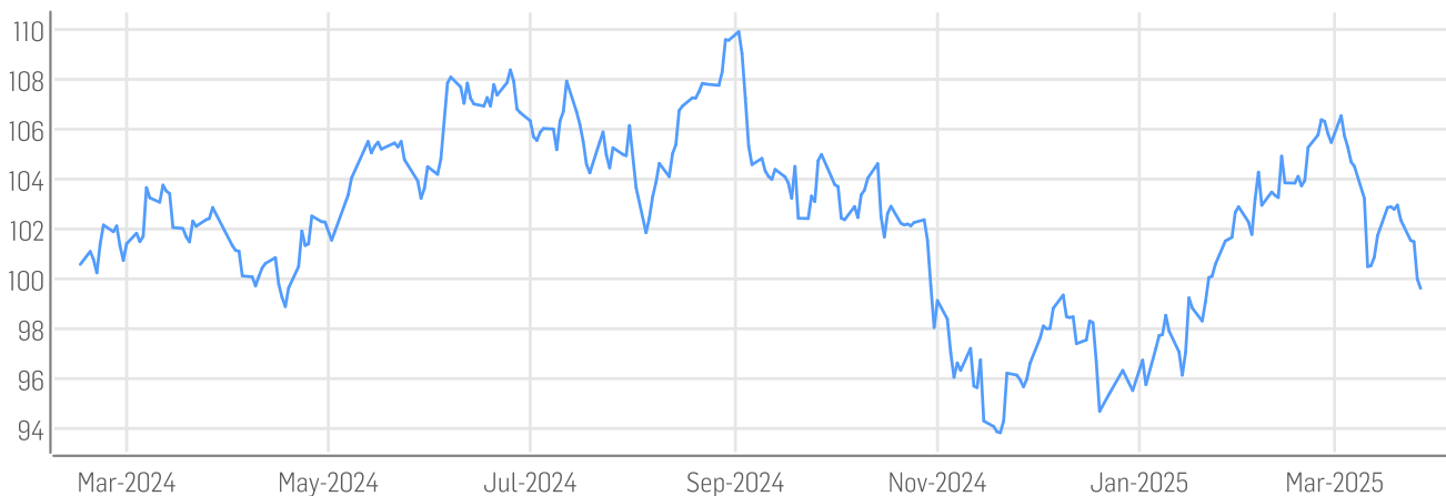
■ DER AKTIONÄR GRANOLAS - European Champions Index