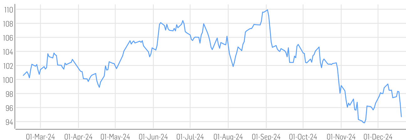
■ DER AKTIONÄR GRANOLAS - European Champions Index