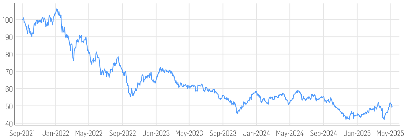
■ AKTIONÄR Zero Plastic Index