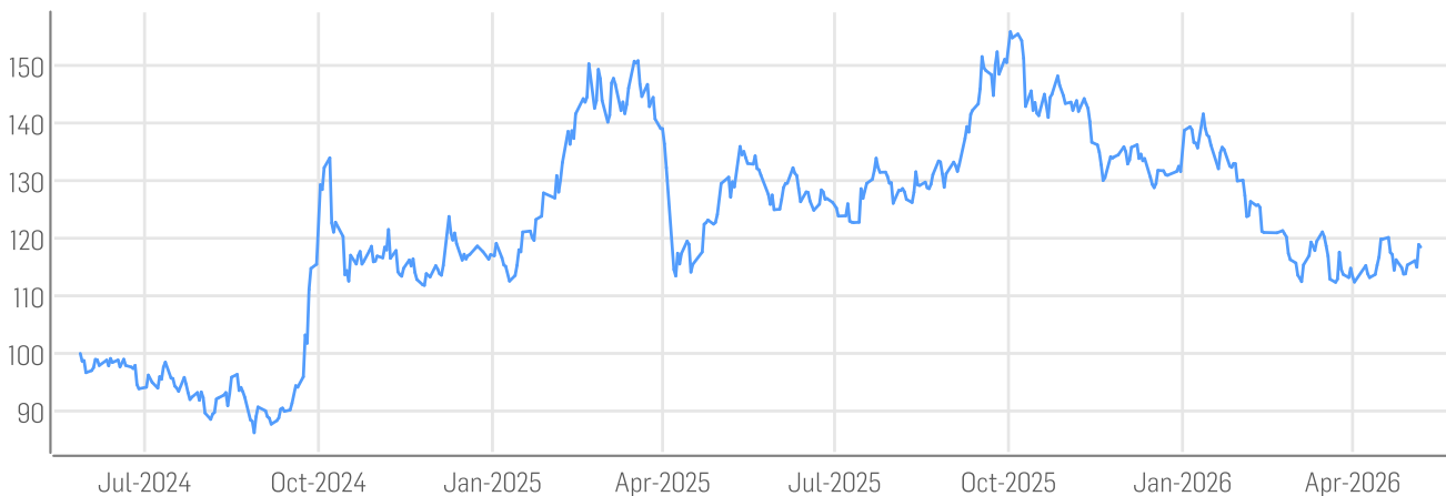
■ DER AKTIONÄR China Tech-Giganten Index