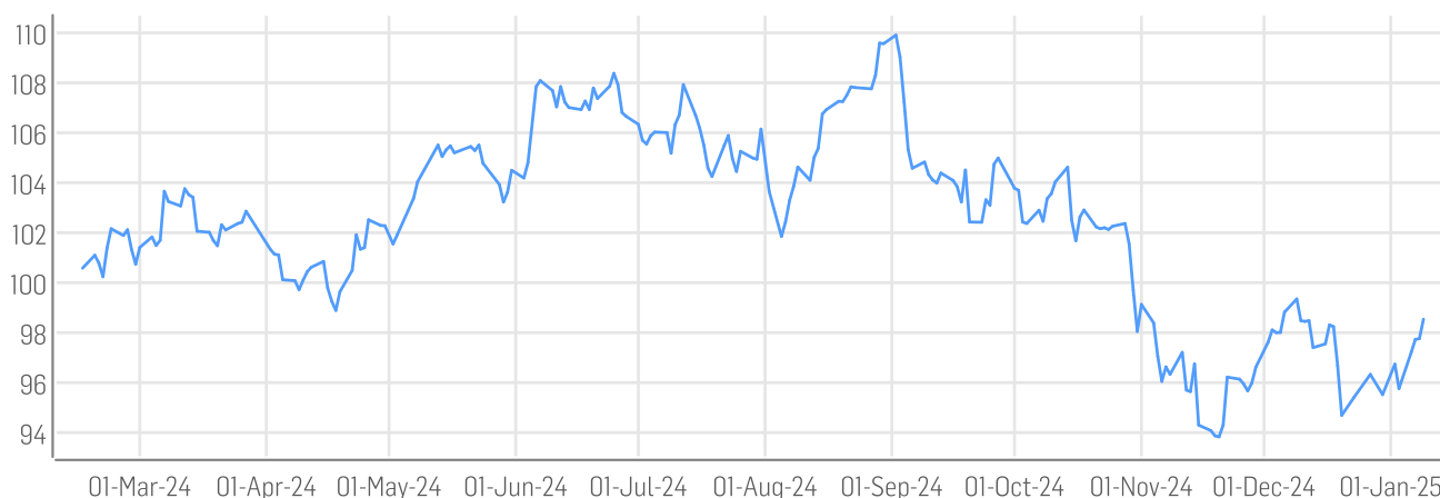
■ DER AKTIONÄR GRANOLAS - European Champions Index