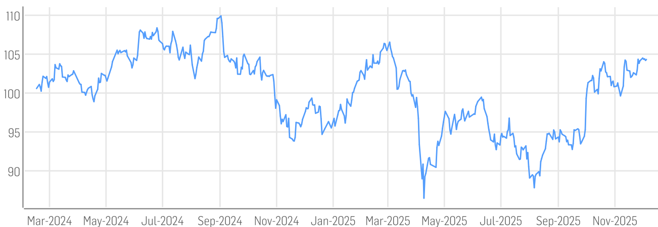
■ DER AKTIONÄR GRANOLAS - European Champions Index