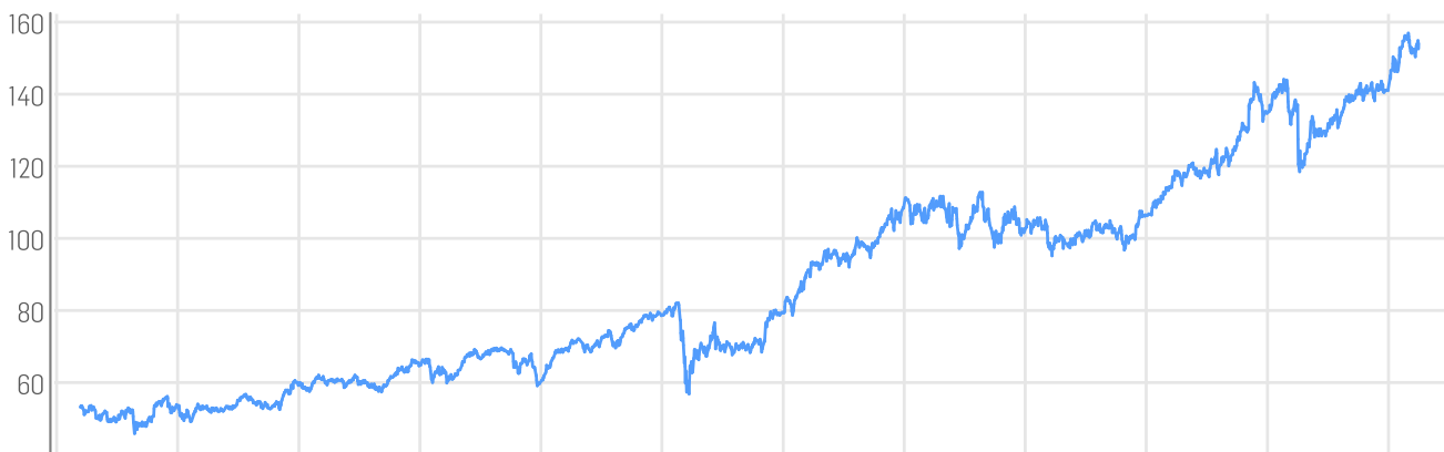
■ BÖRSE ONLINE Globale Dividenden-Stars Index